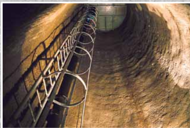
Kanalizační sběrač Frýdlant v Čechách