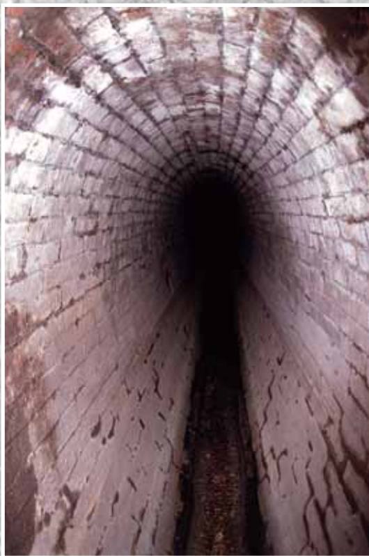
Kanalizační sběrač Praha - Hloubětín